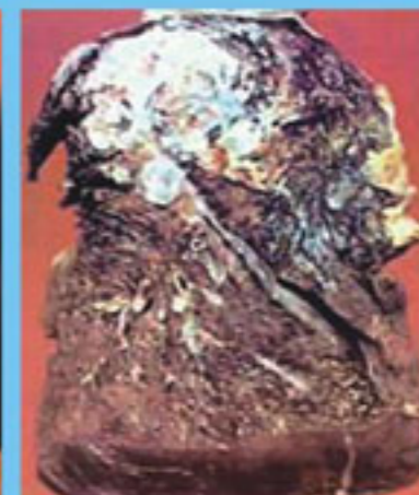
больная ткань легкого

Курение приводит к преждевременной гибели каждого четвертого россиянина.