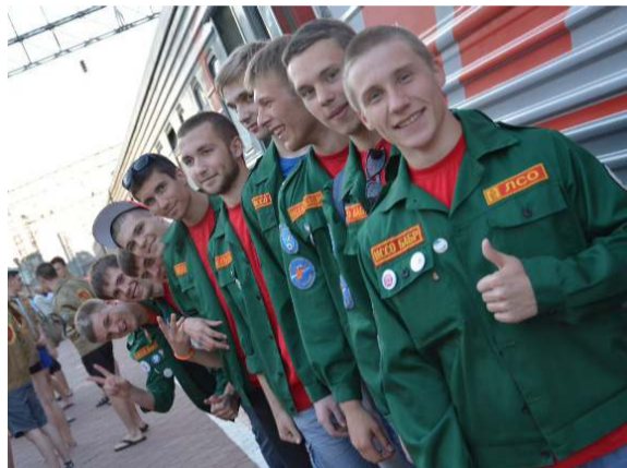
Отправление ребят на космодром «Восточный»

Школа жизни – так характеризуют работу в студенческих отрядах те, кто в свое время прошел эту самую школу. Никто из них не говорит, что это было легко и просто, но все подчеркивают, что ценнейший профессиональный и организаторский опыт они получили именно тогда, когда первый раз оторвались от родителей и наконец-то «понюхали пороху», в нашем случае – строительной пыли.