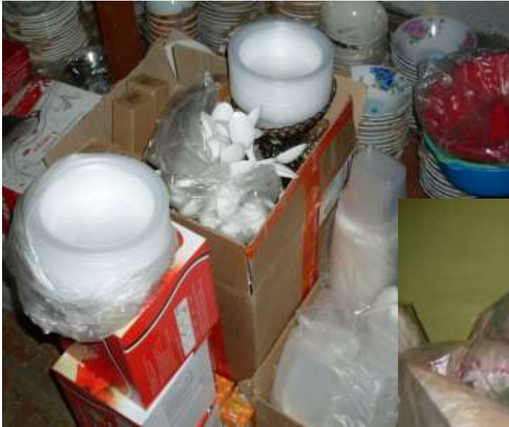
Посуда одноразовая и многоразовая